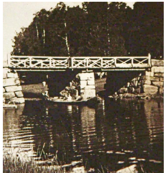
Enojoen silta Karstulassa ennen v.1938, jolloin se uusittiin.