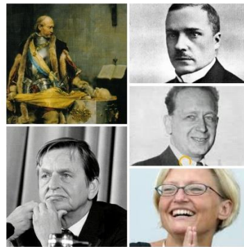
Klaus Fleming, Heikki Ritavuori, Dag Hammarskjöld, Olof Palme ja Anna Lindh.

5. Sirpaleserkku Anna Lindh (1957-11.9.2003) puukotettiin kuoliaaksi, kaiketi 911-nimellä kulkevan 2001 terrori-iskun muistopäivänä.