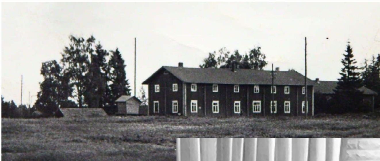
Salintuvan vanhaa kartanoa 1960-luvulta.