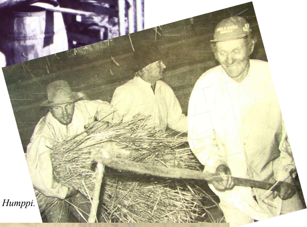
Korppisen ruisriihellä 1976.