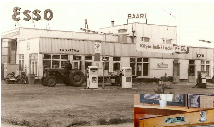
Kyyjärven Esso 1960-luvulla.