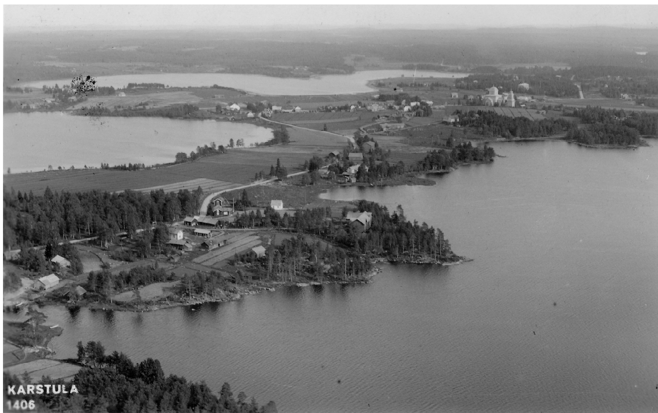
Karstulan kirkonkylä vuonna 1935.