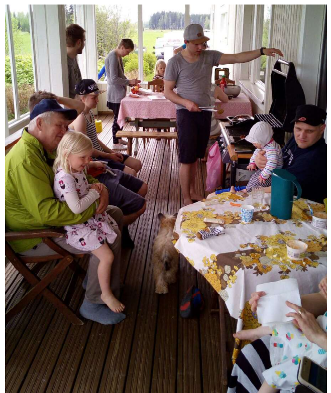
Kesäkokoontuminen Teemun luona Pihtiputaalla.

Tänä kesänä suviseurat järjestetään Äänekosken Liimattalassa. Seuroihin ovat kaikki tervetulleita, katsomaan, kuuntelemaan ja ihmettelemään, mikä on tuo ihmeellinen joukko, joka vuodesta toiseen kokoontuu kuuntelemaan yksinkertaista seurojen ohjelmaa ja tapaamaan tuttuja ja sukulaisia.