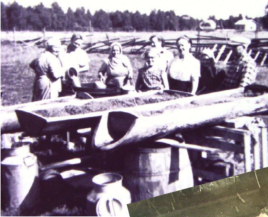
Kruunuhäissä 1955 sahtia tehtiin Salintuvassa.