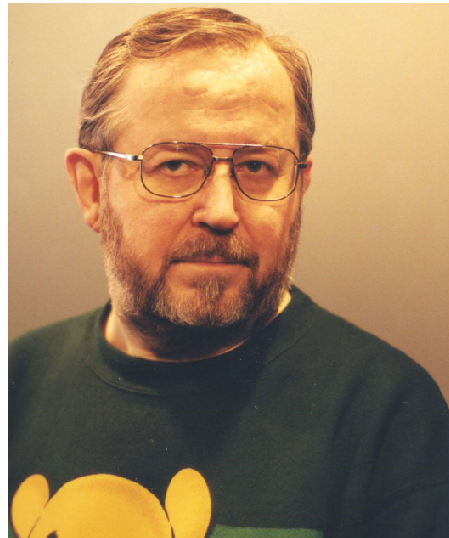
Antti Poikonen (1945–2017)