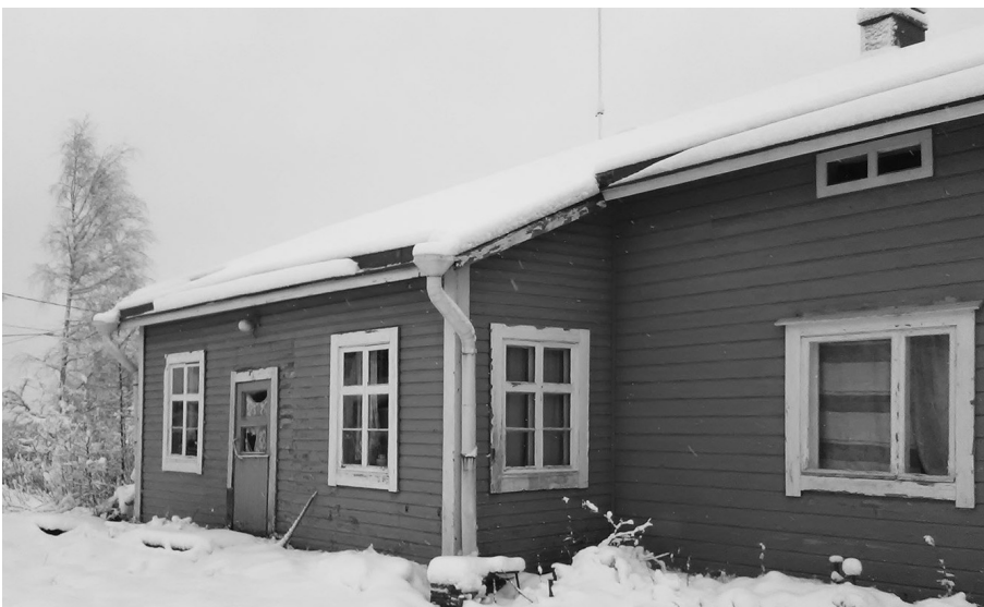
Kuvassa Syrjännäen koti pihanpuolelta

Siitä radiosta, tai sen kuuntelusta, jäi mieleen oikeastaan vain Markus-sedän lastentunnit. Muuten sen kuuntelusta ei ole mielikuvia jäänyt. Kai sitä pidettiin auki vain ”meidän perästä”, kuluihan siinä kallis paristokin.