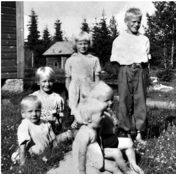
Pöngän Välisaarella 1954

Takseja tai muita koulukyytejä ei siihen aikaan tietenkään ollut, ja kulkeminen Pöngän perältä Humpille ja takaisin pitkin korpia oli sellaista koulunkäyntiä, mitä tämä nykynuorisokykenee tuskin kuvittelemaan-