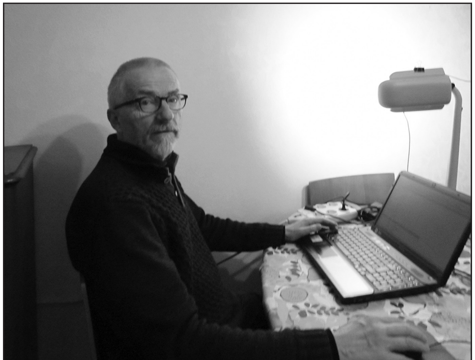
Pertin työasema SSHY:n arkistohakemistojen tietojen täydennyksessä

Ergonomia oli oivallettu jo 30-luvun alussa tekniikan ja toiminnan sovitamiseksi ihmiselle parhaalla mahdollisella tavalla. ”Ruoanvalmistus-kuten muissakin töissä on emännän ajateltava työtehoa ja harkittava työnsäästämahdollisuuksia. On harjoitettava itsensä löytämään ja käyttämään jokaisessa työssä käytännöl-