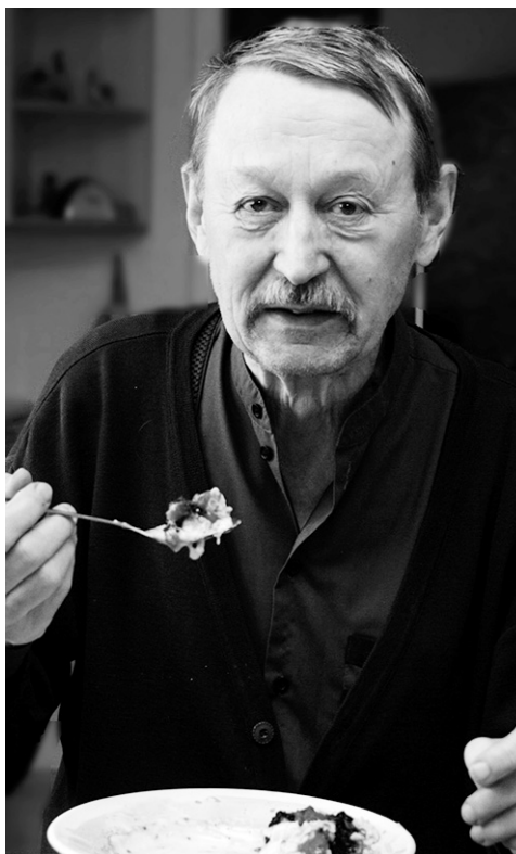
Taiston menetelmä energian hankintaan: puuro, jugurtti ja marjoja - kaikki yhdessä