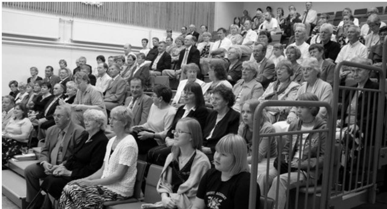
12.6.2005 sukkokokus Karstulan Kansanopistolla (in Karstula Evangelical Folk High School)