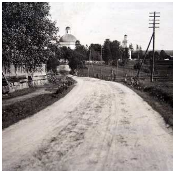
Menneen ajan Saarijärven raittia